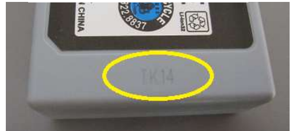
図 2. LOT 番号位置

また、1A 以下の AC アダプターをご使用の場合も、LED の表示が、赤緑交互点滅（0.1 秒間隔の高速点滅）になり、正常に充電が開始されない場合があります。